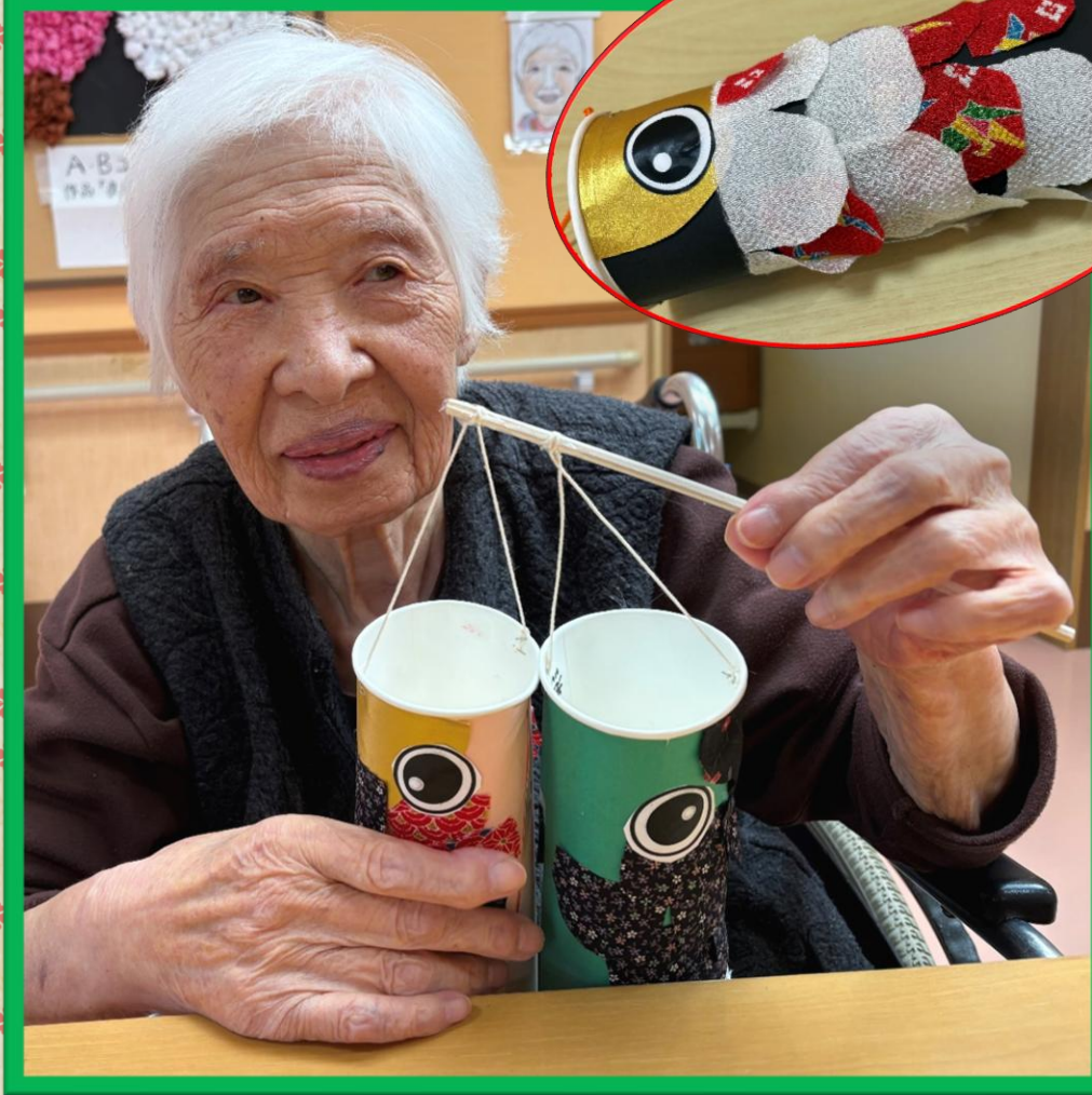
(利用者様作品、鯉のぼり飾り)