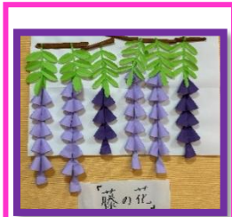
3階の入居者様で作った藤の花(折紙)