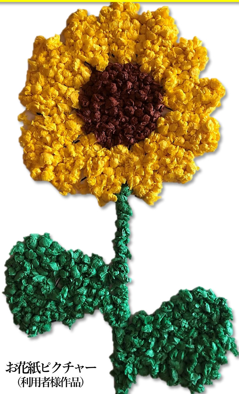
お花紙ピクチャー (利用者様作品)

お花見ドライブ・お誕生日おめでとう 制作レクリエーション・イベント食・七夕飾り 7月の行事予定表・他