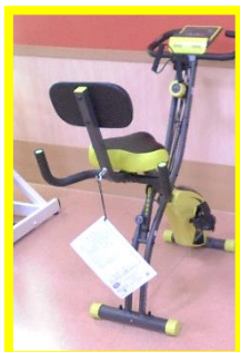
●コンフォートバイク