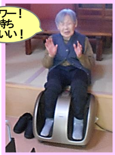
●フットマッサージャー