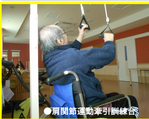
●肩関節運動牽引訓練台